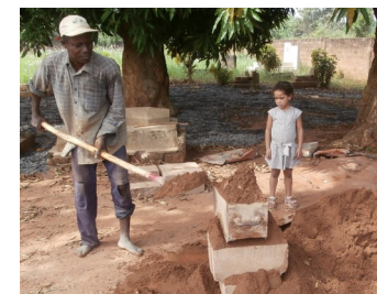
Fabrication traditionnelle de briques

Chaque brique coûte 10 euros. Voir le bulletin détachable au dos du dépliant.