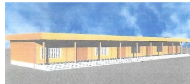
Projet d'architecte pour l'école de Zinvié