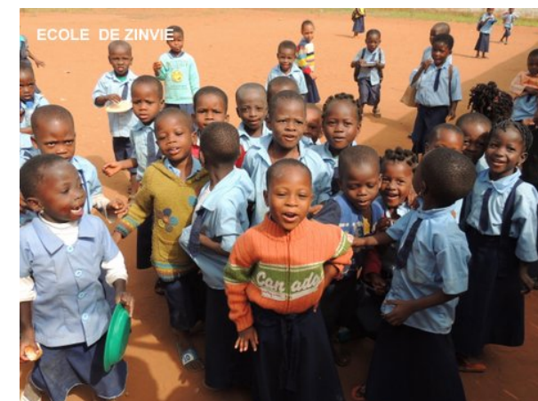
Enfants de Zinvié